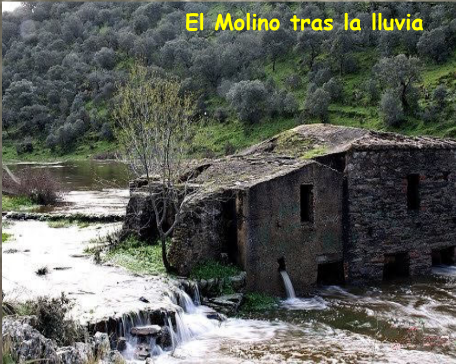
El Molino tras la lluvia