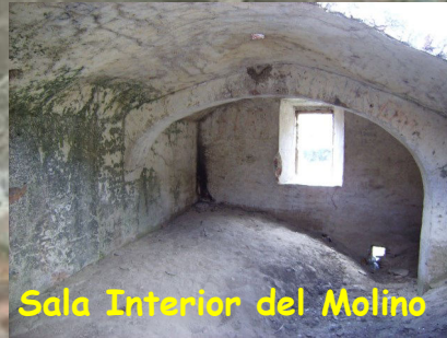
Sala Interior del Molino