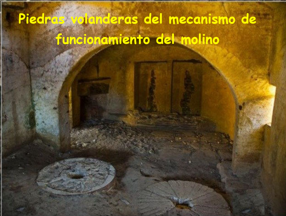
Piedras volanderas del mecanismo de funcionamiento del molino