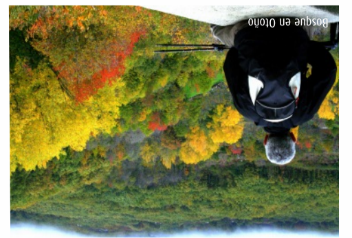
Bosque en Otoño

En las sierras destacan las colonias de rapaces como el águila real, buitres leonados, búhos reales, azores, milanos y aguiluchos. En el valle se esconden algunos ejemplares de linco, mientras que los zorros son fáciles de ver. Ciervos y jabalíes viven en zonas de bosque.