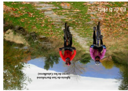
Vía de la Plata

La variedad de paisajes propicia una gran biodiversidad: castaños, robles, acebos o arboles singulares de Extremadura por su monumentalidad, tamaño o edad. Incluso han alcanzado la distinción de ciruelos o almendros. Algunos árboles de abedules comparten el espacio con cerezos, reales, azores, milanos y aguiluchos. En el valle se esconden algunos ejemplares de linco, mientras que los zorros son fáciles de ver. Ciervos y jabalíes viven en zonas de bosque.