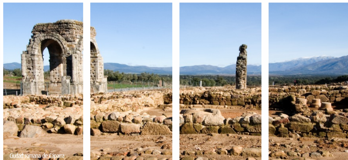
Ciudad romana de Cáparra